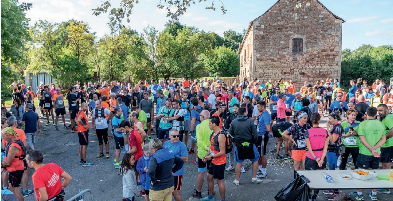
Le départ du semi-marathon s'effectuera au cœur du village de Capelle. Après plusieurs mois d'interruption du calendrier des courses à pied, les coureurs sont attendus en nombre le 12 septembre prochain !