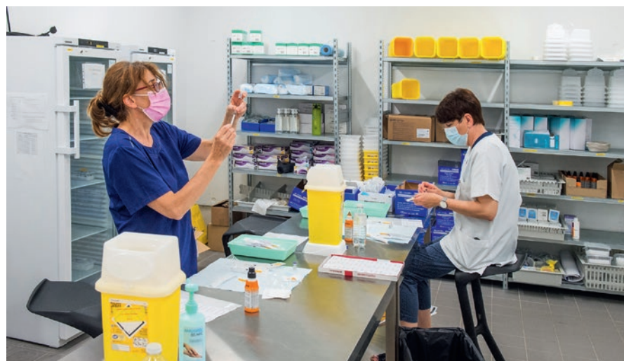
Les doses de vaccins sont préparées au fil de la journée, dans un local spécifique, en fonction du nombre de patients attendus.

du dossier Doctolib. Suite à la consultation pré-vaccinale avec un médecin, le patient est dirigé dans l'un des vingt box, afin de recevoir l'injection. Finalement, après une surveillance de 15, ou 30 minutes selon les patients, la fameuse attestation de vaccination est remise et le « parcours du vacciné » terminé.