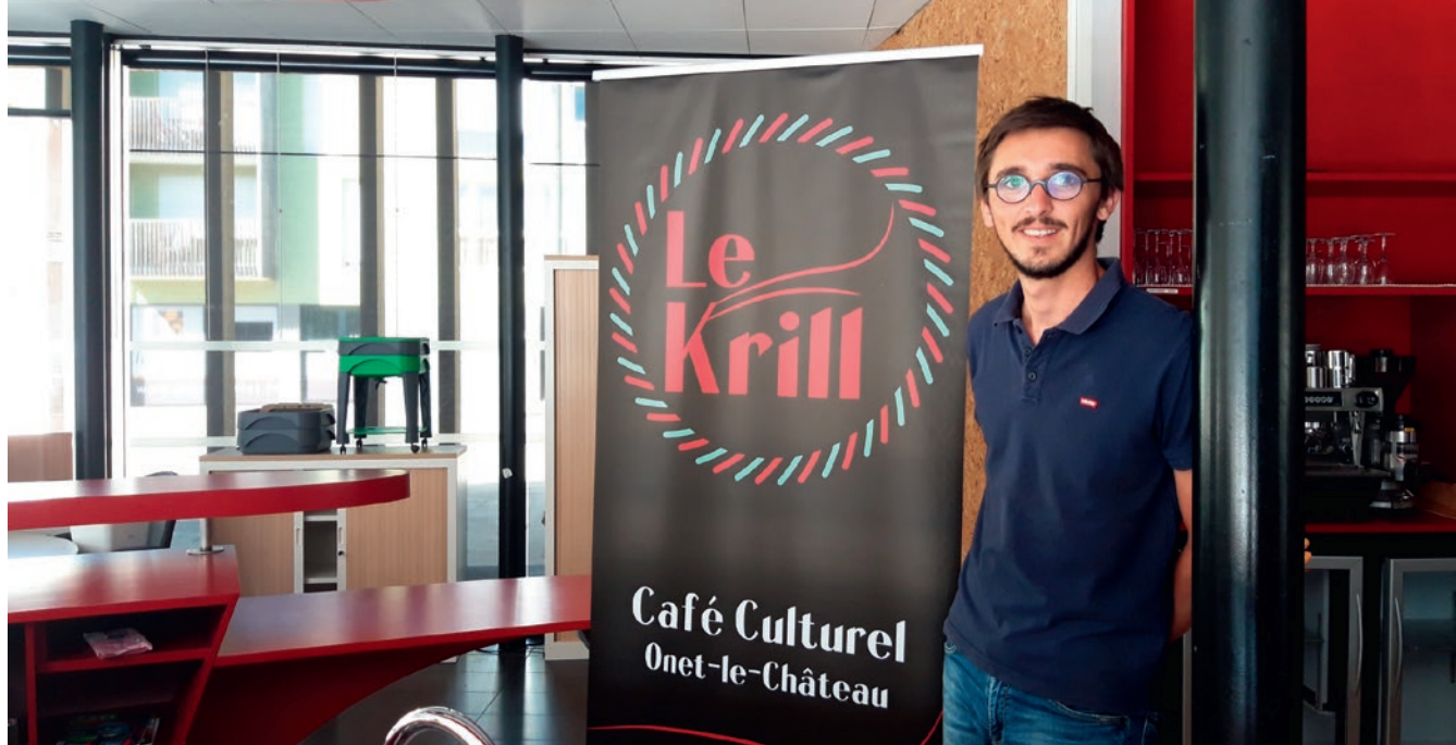
Le Krill ouvrira ses portes le 25 août prochain. Un grand nombre d'animations ouvertes à tous seront proposées.