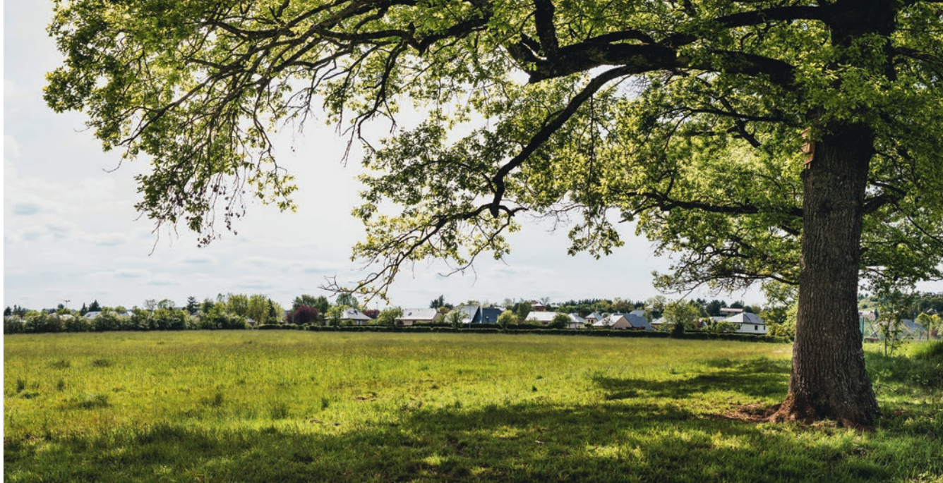
La Plaine Nostre Seigne abrite une impressionnante variété d'espèces en matière de faune et de flore. Amphibiens, martins pêcheurs, bécassines des marais (photo ci-dessous), rapaces ont élu domicile au cœur de cet espace naturel.