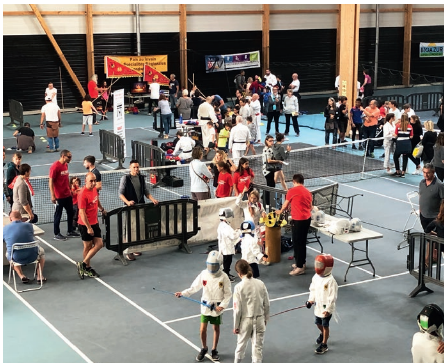
Le tissu associatif sportif Castonétois proposera des activités en intérieur et en extérieur au sein du complexe de tennis des Balquières.