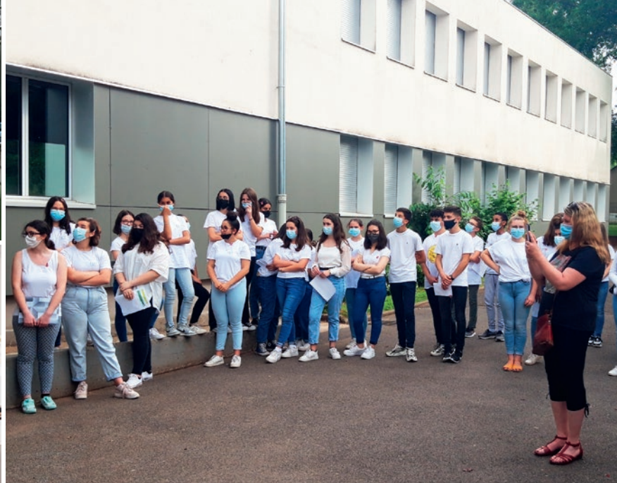
Les délégués du collège des Quatre-Saisons ont présenté l'exposition aux familles, à l'occasion du vernissage qui s'est tenu au sein de l'établissement le 18 juin dernier.