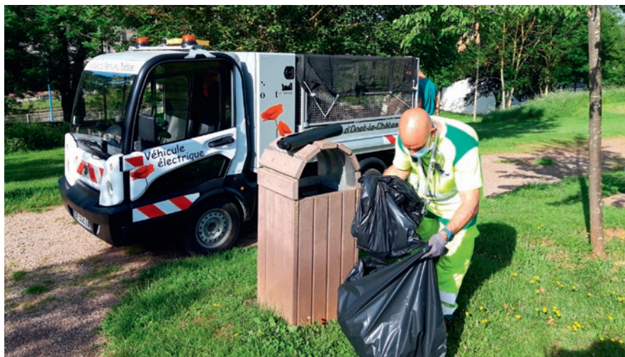
L'équipe voirie parcourt le territoire castanétois de 7h à 15h en continu. La priorité est donnée aux places et rues commerçantes, tôt le matin.

Agir pour l'environnement se résume parfois à un geste aussi simple que de jeter ses déchets dans la poubelle. Avec l'arrivée des beaux jours nous sommes tous friands de balades au grand air. Toutefois, ce plaisir est parfois gâché par les déchets qui jonchent régulièrement le sol.