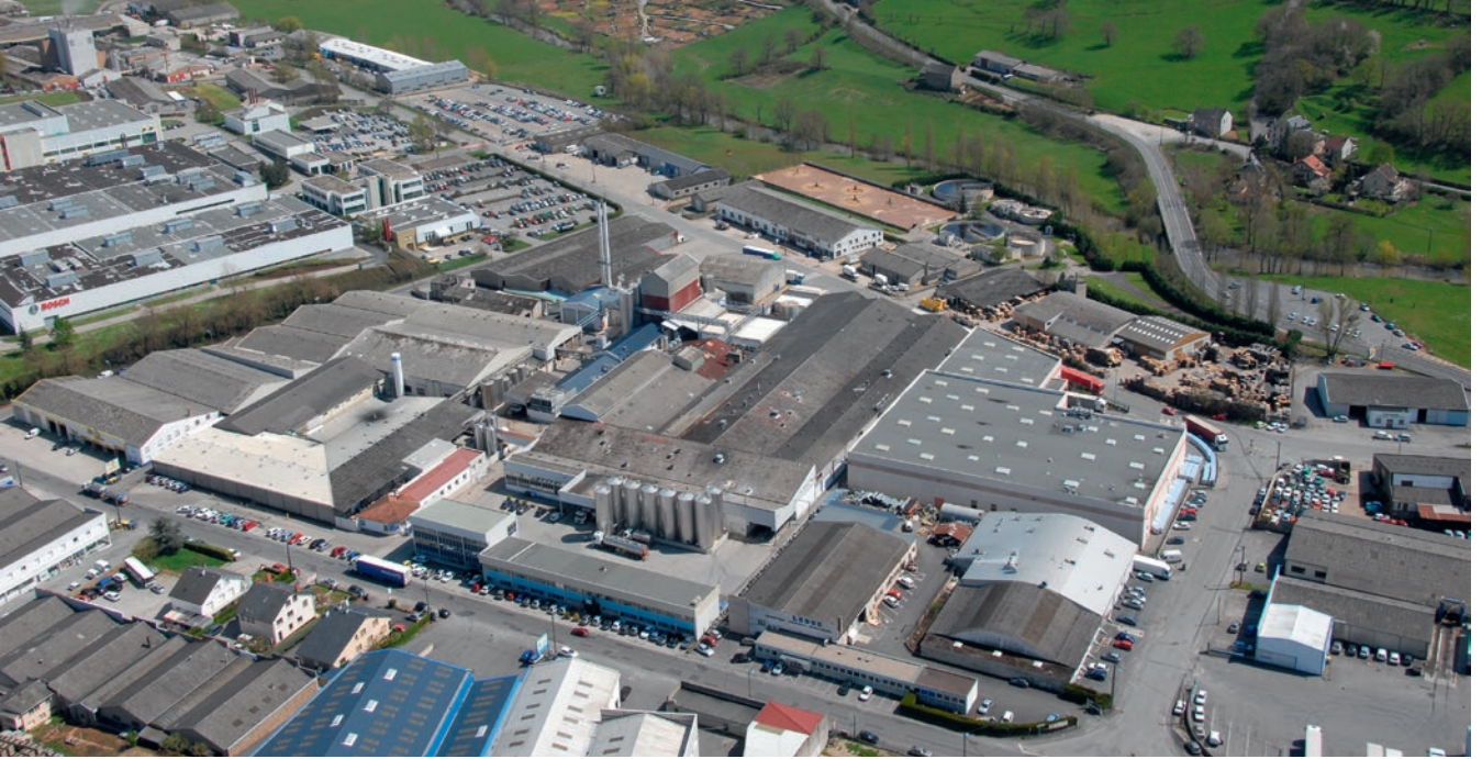
Le site industriel s'est implanté en 1963, zone de Cantaranne. La société fromagère et laitière du groupe Lactalis a su, ces dernières décennies, se développer et investir pour promouvoir l'innovation, la qualité et la diversification des productions.