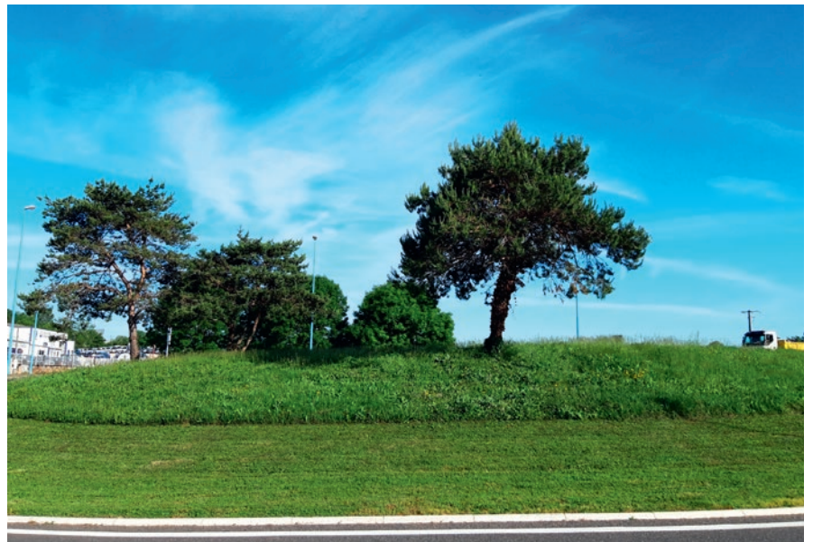
La gestion différenciée, ou le souci de mieux respecter la biodiversité des espaces verts. Ici, le rond-point de La Roque, route d'Espalion.