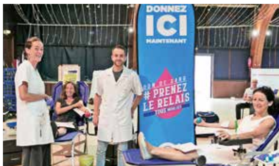
9 juillet - Don du sang à la salle des fêtes