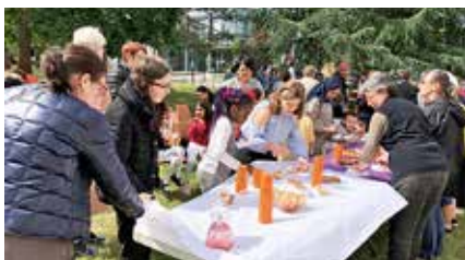
La fête du Centre Social s'est déroulée le 12 juin dernier en présence de nombreuses familles.

→ Retrouvez toute l'actualité du Centre Social sur http://centres-sociaux-caf-aveyron.fr/onet/ et sur la page facebook.