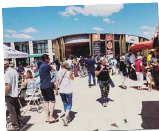
15 juillet - Passage du Tour de France