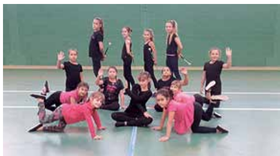
Le club castonétois s'entraîne régulièrement au gymnase de La Roque.

Onet-le-Château possède un important tissu sportif associatif. Le territoire compte aussi des sports plus confidentiels mais qui constituent l'identité de la commune, tels que le club Onet Twirling Bâton, créé il y a plus de 7 ans.