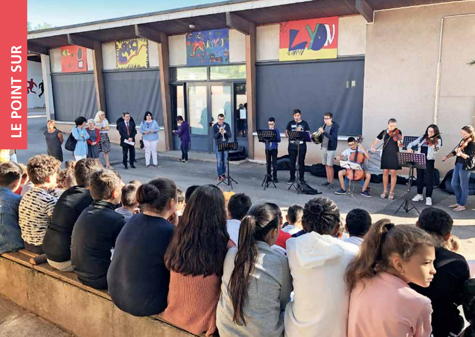
La rentrée s'est faite en musique à l'école des Genêts avec une prestation musicale des élèves de la classe CHAM (Classe à Horaires Aménagés Musique) du collège des Quatre-Saisons.