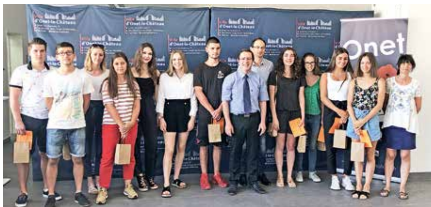
16 juillet - Cérémonie des Bacheliers en l'Hôtel de Ville