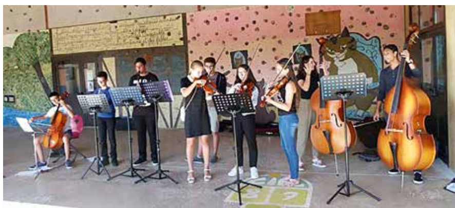
L'enseignement musical est dispensé par des professeurs du conservatoire à Rayonnement Départemental de l'Aveyron.

Cette année encore, les élèves de CM2 et CM1 du groupe scolaire Pierre Puel et de l'école des Genêts bénéficieront de l'apprentissage d'un instrument et d'une sensibilisation à la musique pour les CE2 de l'école Jean Laroche et du groupe scolaire Pierre Puel. Au cours d'un parcours musical et pédagogique, les enfants apprennent à jouer d'un instrument mis gratuitement à leur disposition. C'est sur