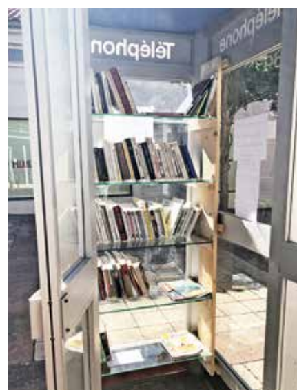
Echanger des ouvrages, voilà le concept de la boîte à livres.

est simple, chacun peut y déposer librement, échanger ou emprunter des ouvrages en bon état et decents. La cabine est donc un lieu de vie à part entière qui offre un accès facilité à la lecture au cœur de la place des Rosiers. L'animatrice de proximité de l'association Progress approvisionnera régulièrement la boîte à livres et s'assurera de son bon état d'entretien.