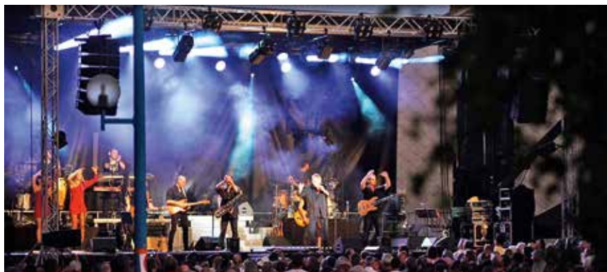
28, 29 et 30 juin Festivités des Quatre-Saisons

La rédaction vous propose de jeter un coup d'œil dans le rétroviseur des actualités culturelles, sportives et économiques... qui ont ponctué la vie des Castonétoises et Castonétois cet été.