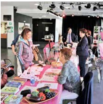
Rendez-vous le jeudi 17 octobre au krill pour une journée de prévention-santé.

alors que la Médiathèque se parera de parapluies roses, autre symbole de cette campagne nationale.