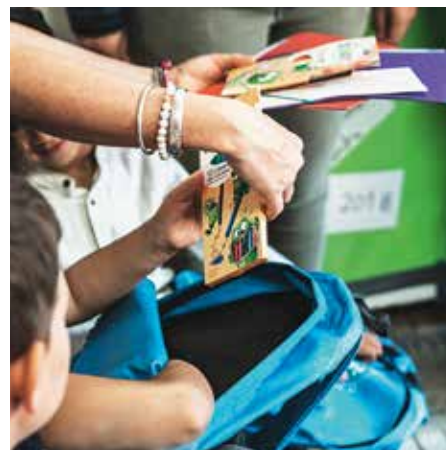
Les élèves de CP des écoles publiques et privées se sont vus remettre un sac à dos et un kit de fournitures.