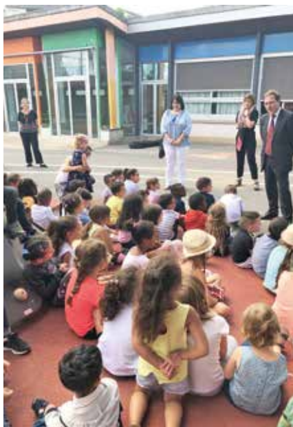
Les élèves de maternelle de l'école des Narcisses.

Comme chaque été, en l'absence des petits écoliers, les agents des services techniques municipaux ont procédé à l'entretien des établissements scolaires au travers de réparations diverses et d'aménagements notamment au sein des salles de classes. Cette période fut également l'occasion de réaliser des travaux plus conséquents dans certaines écoles.