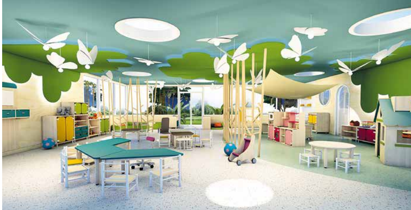
Les équipes de l'entreprise castanétoise imaginent, dessinent et conçoivent une gamme de mobilier pour la petite enfance, au sein de son usine, zone de Cantaranne.