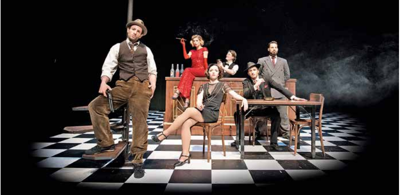
Le spectacle « Speakeasy » (27/02 à 20h30) nous plongera à New York dans un bar clandestin des années 30 avec une ambiance digne des films de gangsters