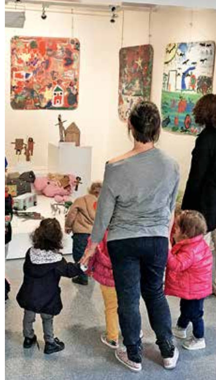
La MJC conçoit et développe ses actions depuis dix ans, dans un esprit d'ouverture, de rencontre et de partage.