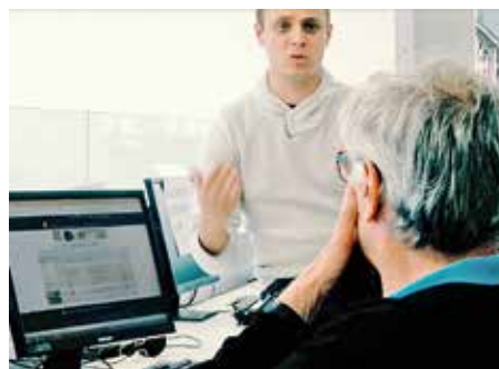
Le C.C.A.S. propose des actions et ateliers à destination de la population castonétoise, avec comme dénominateur commun la prévention.