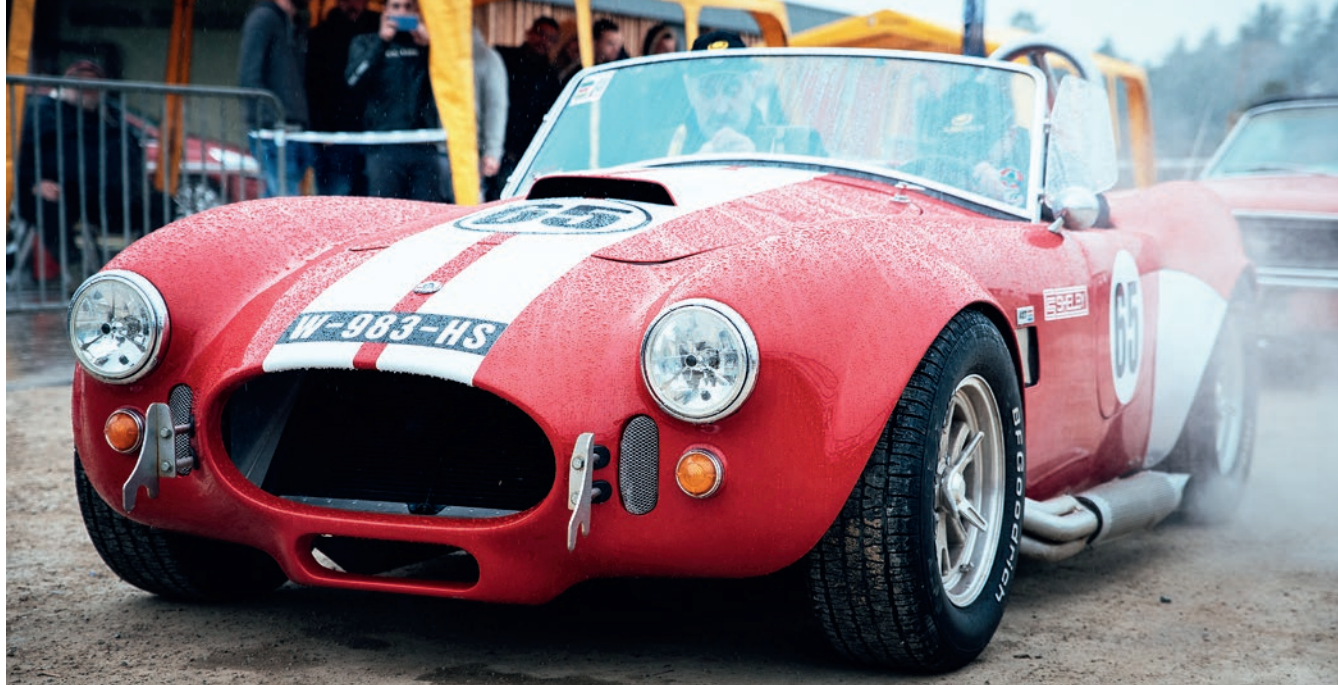
43 équipages ont participé à cette 2 e édition de l'Aveyron Tour Story.