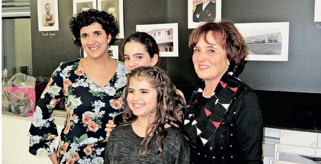
L'esprit de famille, au cœur de la réussite de l'entreprise Azorin Carrelage.