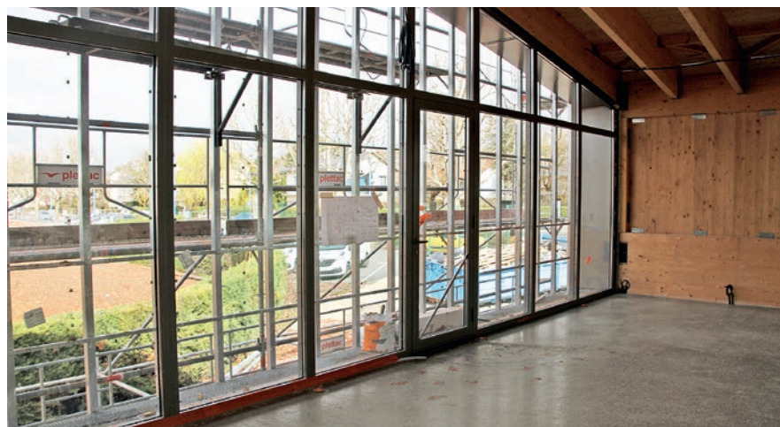
L'aménagement intérieur se veut agréable et fonctionnel de par la répartition des espaces.

accueillant pour les habitants, que cela leur donne envie de franchir les portes. Je pense qu'il va bien s'intégrer dans l'environnement. Son accès est aussi bien pratique et facile par rapport au boulevard des Capucines.