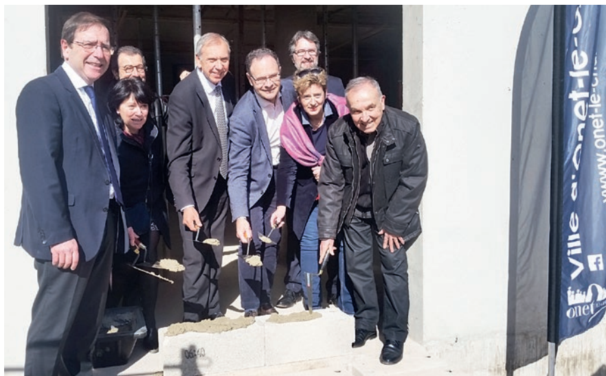
Ce projet de Résidence Intergénérationnelle, piloté par la société Sud Massif Central Habitat, a obtenu le soutien de plusieurs entités publiques.

Dans le détail, le projet comprendra une maison d'assistantes maternelles (MAM) qui accueillera huit enfants au quotidien, deux logements de type T1bis, acquis par le C.C.A.S. d'Onet-le-Château à destination d'internes en médecine (exerçant au sein de la Mai-