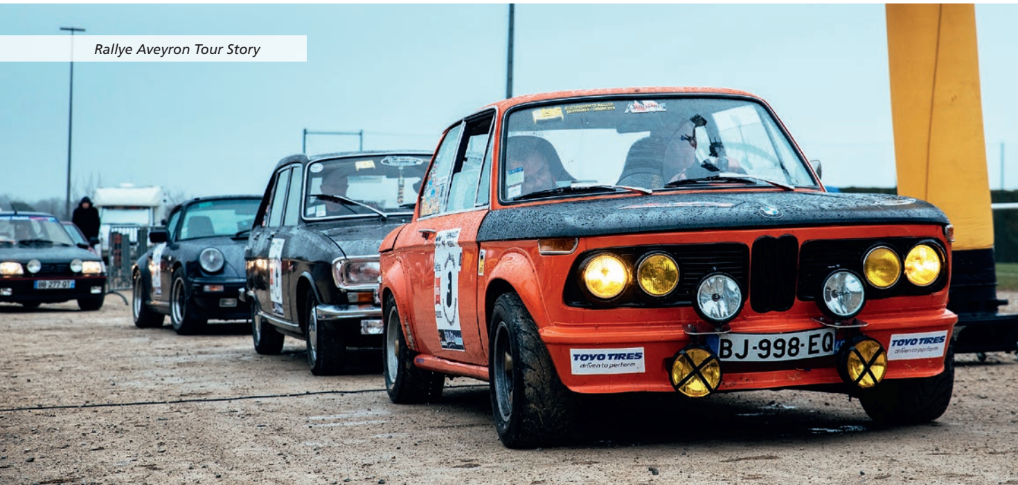
Rallye Aveyron Tour Story