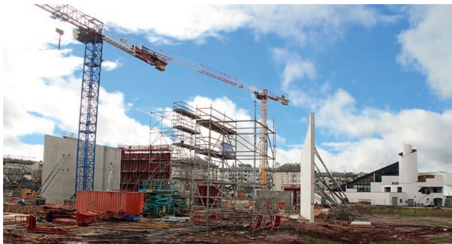
L'équipement socio-culturel et sportif devrait être achevé début 2020.

L'infrastructure, qui portera le nom du regretté président du comité des fêtes des Quatre-Saisons, Robert Rouquié, sera composée de trois volumes « émergeant » d'un socle commun et s'inscrira dans la continuité du traitement architectural de la piscine/médiathèque Paul Géraldini. L'équipement socio-culturel et sportif comprendra un vaste espace d'animations de 4000 m 2 . D'une capacité de 750 places assises (2400 places debout - tribune rétractable motorisée de 450 sièges), cette salle des fêtes « nouvelle génération » aura pour ambition d'accueillir des