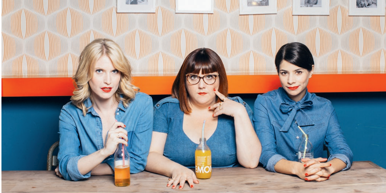
Humour et chanson le vendredi 7 juin sur la scène de La Baleine, avec le spectacle « Les Coquettes - A la coquette du monde ».