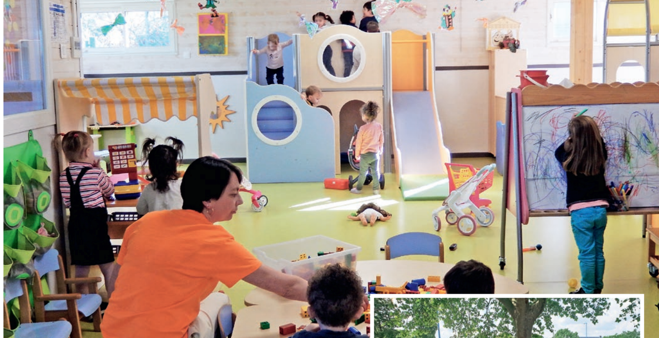
Des activités pour rendre l'enfant plus autonome en respectant son rythme de vie.