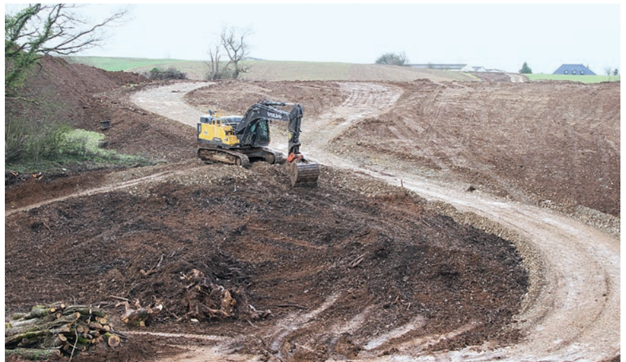
Les opérations de terrassement sont en cours sur l'ensemble du chantier.

Le chantier fait l'objet de mesures environnementales importantes avec, notamment, la préservation d'un chemin rural entre la RD 568 et l'avenue du Cause et une insertion paysagère soignée. La possibilité de la création d'une voie verte a été prévue. Celle-ci pourrait, dans le cadre du programme de l'Agglo en ce domaine, permettre de compléter la jonction spécifique entre le centre de Rodez et le parc de Vabre par Bel-Air. Les fouilles archéologiques désormais terminées, les terrassements sont en cours.